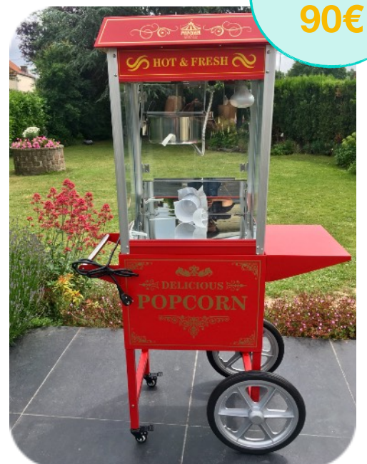
Machine à Pop-Corn fournie avec gobelets et fournitures pour 100 personnes