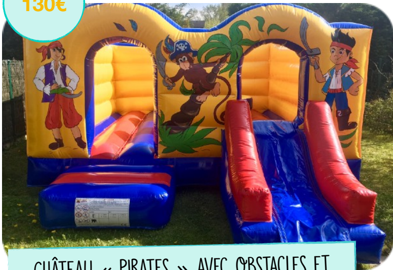
CHÂTEAU « PIRATES » AVEC OBSTACLES ET TOBOGGAN 4M X 5,5M