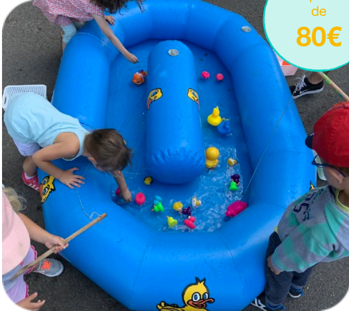
Pêche aux canards gonflable haute qualité, avec cannes à pêche, petits canards.