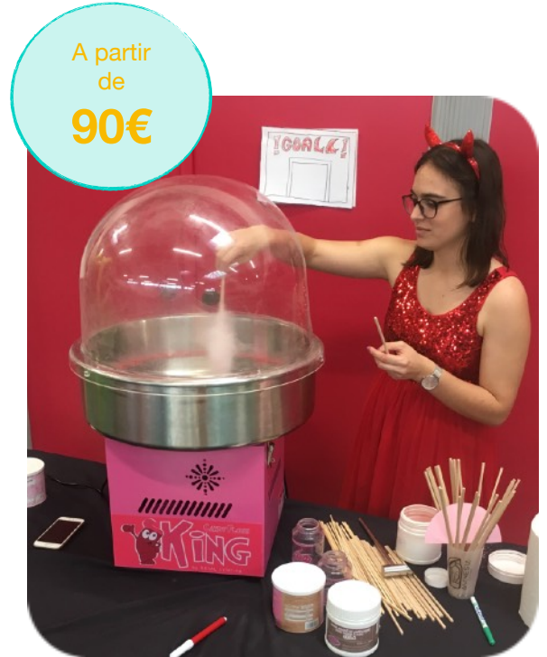
Barbe à Papa fournie avec bâtons et sucres pour 100 personnes